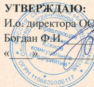
График проведения проверок вентиляционных каналов МКД на 2024 год